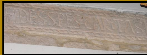
PRIMEIRA INSCRIPCIÓN CRISTIÁ DE GALICIA