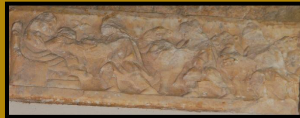
ADORACIÓN DOS REIS MAGOS DA TAPA DO SARCÓFAGO

Atópase tamén neste templo a primeira inscrición cristiá de Galicia e unha pomba esculpida en pedra, que tamén formarían parte do mausoleo.