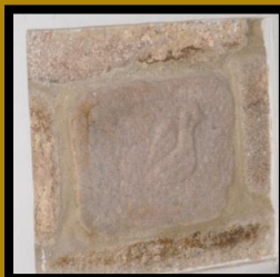
POMBA ETAPA PALEOCRISTIÁ