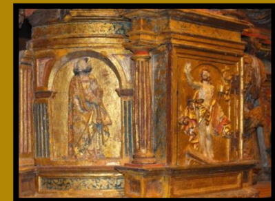
DETALLE DO SAGRARIO RENACENTISTA DO ALTA MAIOR

No retablo principal destaca o sagrario de tipo renacentista, que data de finais do século XVI, este presenta a Cristo resucitado na porta, a San Pedro e San Pablo nos laterais. O retablo maior é salomónico que data do século XVII.