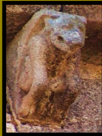
MODILLÓN DE SANTIAGO DE LOSADA