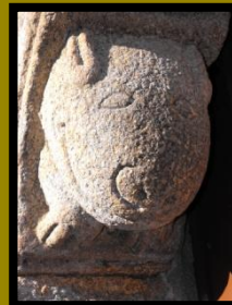
MODILLÓN DE AGUADA