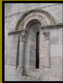
VENTANA ÁBSIDE DE SANTA BAIÁ