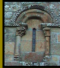
VENTANA ÁBSIDE DE PRADEDA